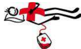
le don du sang